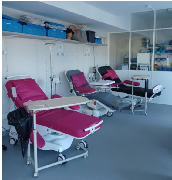
Nouveaux locaux UCP