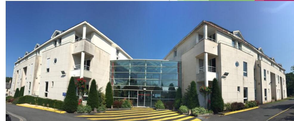
L'EHPAD de Champ-Fleury